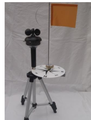
Figur B: Vindretningen