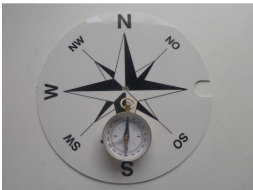
Figur A: Sådan skal kompasskiven se ud.

Når stativet står rigtigt, skal I se på vindfanen. Trådbøjlen står i den retning vinden KOMMER fra og flaget står i den retning vinden blæser (Figur B).